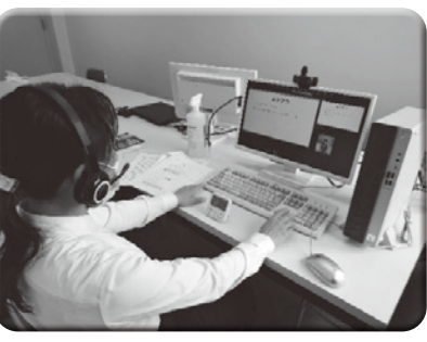
オンライン接客英語研修の様子

研修の流れやカリキュラム等は下記QRコードからご覧いただけます。なお、次回第2期の募集は6月を予定しています。詳細については、後日、書面にて改めてお知らせします。